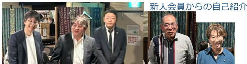
新人会員からの自己紹介