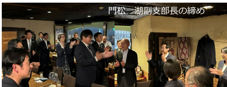
門松一湖副支部長の締め